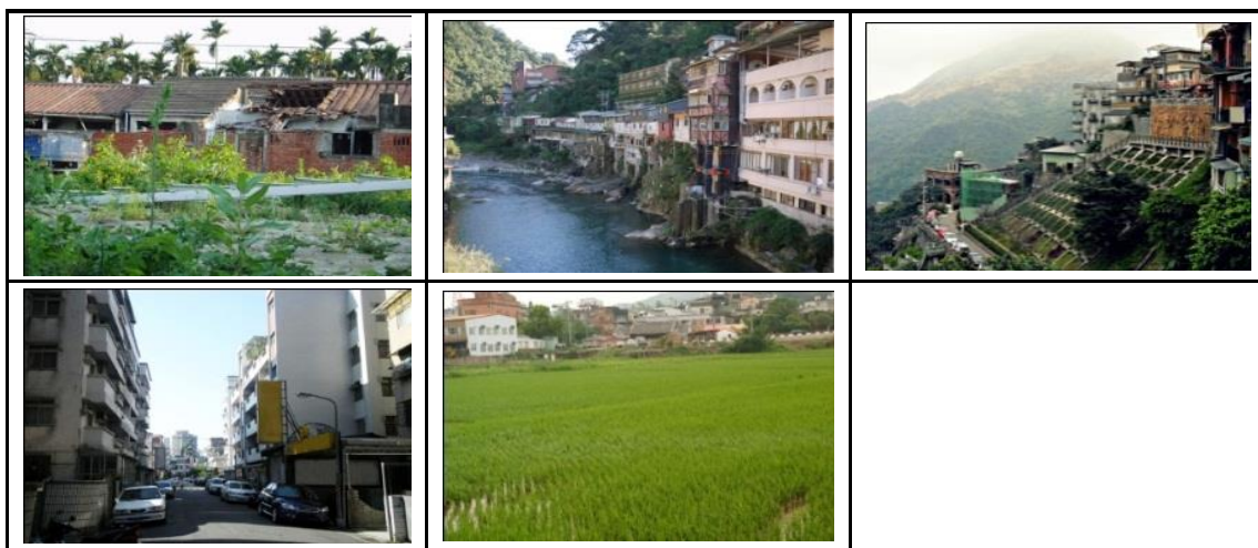
表 4-1-3 問卷照片表