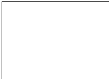
電腦媒材繪圖作品