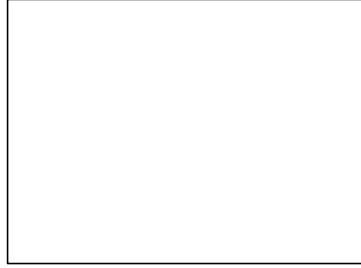
傳統媒材繪圖作品