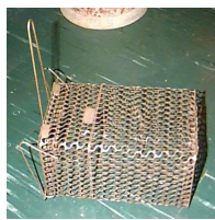
捕 鼠 籠

精緻的 熟悉的 耐久的 便宜的 操作簡單 單純的 美觀的 現代的 平實的 溫馨的 實用的 高雅的 安全的 有效率 可靠的 必要的