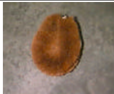
洗 碗 刷