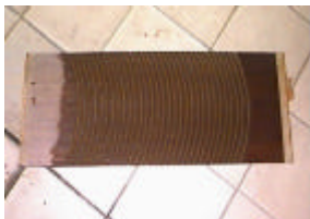
洗 衣 板

精緻的 熟悉的 耐久的 便宜的 操作簡單 單純的 美觀的 現代的 平實的 溫馨的 實用的 高雅的 安全的 有效率 可靠的 必要的