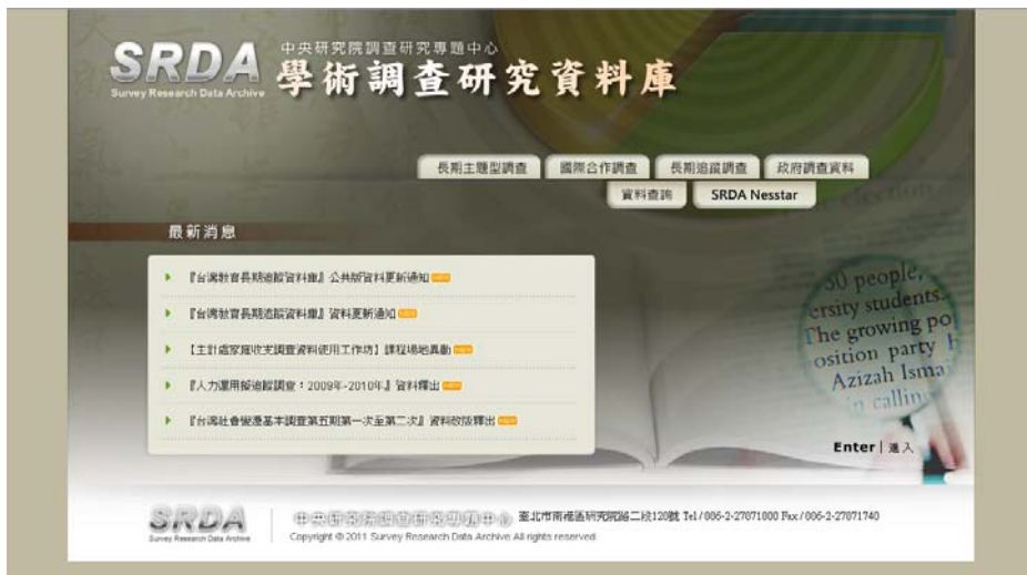
圖一 SRDA 形象首頁

SRDA 網站在改版後，首先以網址 https://srda.sinica.edu.tw 進入的是形象首頁，內容包括近 5 則最新消息；另外還有 SRDA 釋出資料的新分類：長期主題型調查、國際合作調查、長期追蹤調查、政府調查資料等，可以看到 SRDA 收錄資料的特色。如有其他需求，可以利用「資料查詢」的頁籤進入，或選擇直接進入 SRDA: Nesstar 網站進行線上統計分析，亦可直接點選右下方「進入」，即可進入首頁內頁看到網站的全貌。